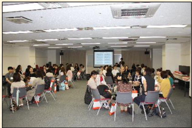
※写真は第1回の様子